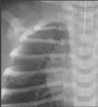
Imagem original da coluna vertebral e da caixa torácica com redução de ruído considerável