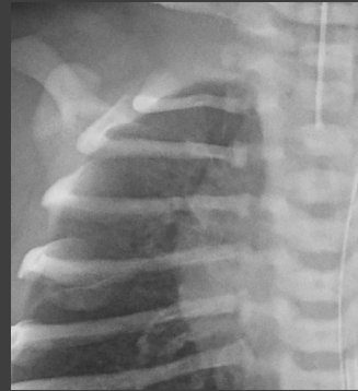
Imagem com o ruído removido para proporcionar mais nitidez e facilidade de leitura