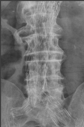
Dose nominal a uma velocidade de 400 com processamento EVP Plus padrão. Imagem adquirida a 75 kVp, 28 mAs, grade 12:1 de 80 pol./cm, IEC EI 272